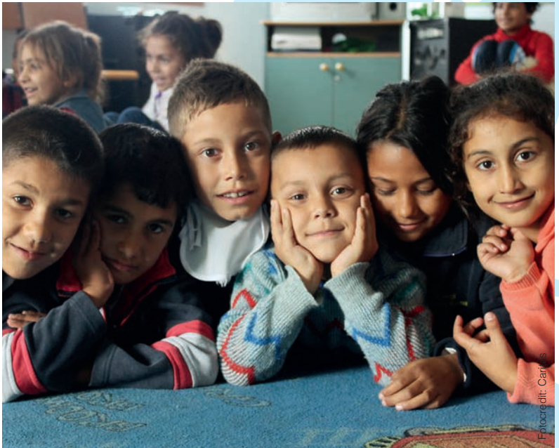
Im Tageszentrum Haus Eden für Straßenkinder in Tirana erfahren Kinder oft zum ersten Mal Gemeinschaft und Geborgenheit.

nische Versorgung, warme Mahlzeiten und Hilfe beim Lernen. Im Haus Eden steht das Wohl des Kindes im Mittelpunkt. Für jedes einzelne Kind werden individuelle Unterstützungsmaßnahmen entwickelt. Ganz wichtig dabei ist der Kontakt zur Familie, zu den Lehrer/innen und zu allen, die mit dem Kind in Berührung kommen. Jugendlichen wird geholfen eine Berufsausbildung zu erlangen. Es gibt eine Kooperation mit einem Berufsausbildungszentrum, wo auch die eine Chance bekommen, die die Schule abgebrochen haben.